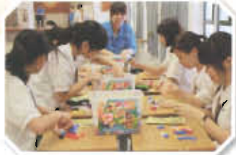
透過「模擬小社會」活動，同學學懂面對抉擇，及早定下人生目標。