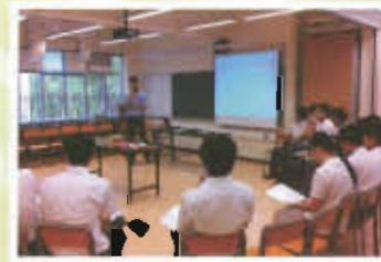
幹事交流會及培訓課程