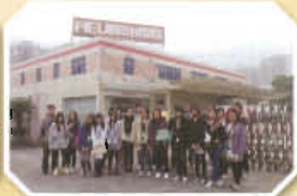
參觀明治食品公司