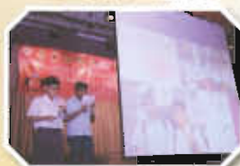
閉幕典禮上分享學習成果