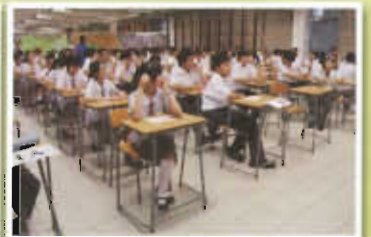
中一制服團隊工作坊