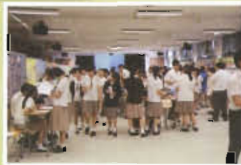
聯招日同學反應踴躍

此外，本組舉行新舊幹事交流會及培訓課程，內容包括 P.I.E. 設計法及 6W+2H++E 設計法，令學會主席掌握設計活動時需考慮的事項，亦透過各學會成功舉辦的活動互相觀摩學習，用以提升律己敬人，自重有禮的意識。