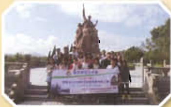
開平碉樓七壯士紀念碑

了解國內最新的野生動物保育、文物保育、環保工作以及最新的經濟發展，同學於是次考察活動獲益良多。