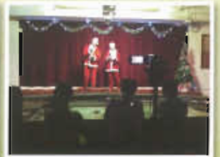
聖誕老人主持歌唱比賽