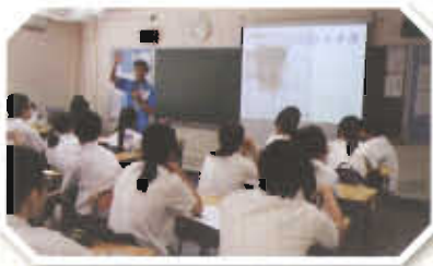
協助中四同學適應高中學習，定立目標。