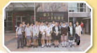
兩地學生參觀秦俑展覽