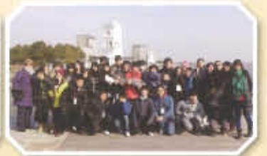
於上海的參觀活動

除上述交流活動外，本組還籌辦多項活動。兩位中五同學參加由和富慈善基金舉辦為期一年的傑出公民學生訓練計劃。本組帶領三十五位同學參觀香港藝術館專題展……乾隆的秘密花園；七十位同學參加由香港菁英會主辦，假香港會展舉行的菁英論壇；七十位同學參觀香港歷史博物館專題展——一統天下：秦始皇的永恆國度。