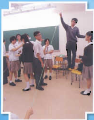
大哥哥大姐姐為學弟妹設計遊戲

中四、中五級的學長，與中一級同學配對，照顧中一級同學的需要。學長們完成訓練課，與中一同學參加室內射擊訓練及興趣班。