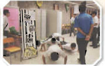
有同學選擇投考警務處，正努力地進行體能測試。