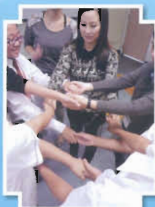
家長與子女攜手解難

除了以上活動外，本組還在全校推行「我做得到」龍虎榜、摘星計劃—校內熱心服務獎、「自我完善」計劃-I-Pad (I-Positive Attitude Development) Scheme、簽訂「目標協約書」和「我的小小觀察」等一系列活動，鼓勵同學認真求進、自重有禮。