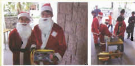
公益金使服日籌款