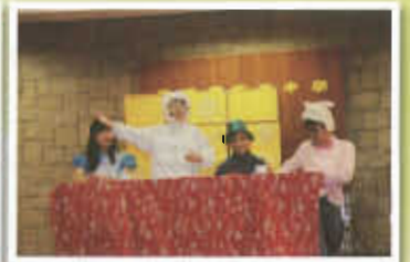
歌舞昇平迎聖誕活動