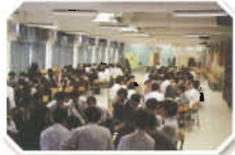
同學體驗放榜當日的流程，學習面試技巧及如何為自己升學或就業作出選擇。