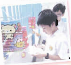
中秋節猜謎遊藝，感受中華文化有趣之處