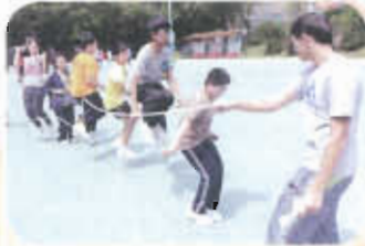
青苗營剪影——齊來躍出新天地