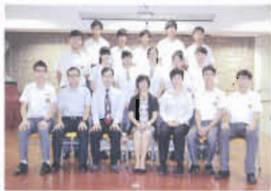
新一屆學生會PUZZLE順利當選

本校學生會成立於1968年。執行內閣以一人一票的民主方式選出，致力為學生謀取福利，提供優質服務，並定期舉辦各類型活動，包括聯校活動，以發展身心。學生會亦開設平台，蒐集同學意見，向校方反映訴求，協助創建和諧校園。