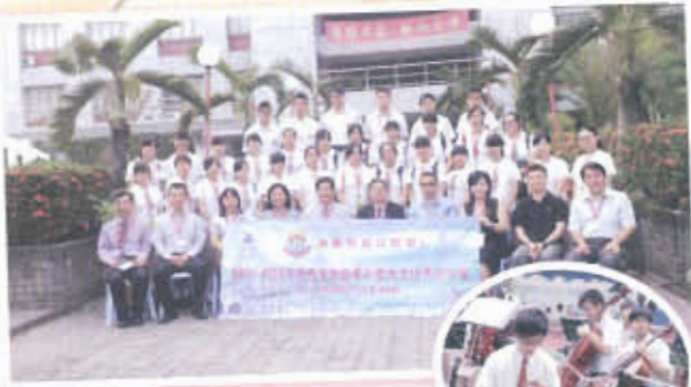
我校師生到馬來西亞參加歷史文化考察之旅