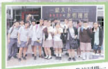
新加坡香港交流計劃—我校同學一盡地主之誼，帶領新加坡學生到歷史博物館參觀