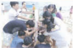
領袖生訓練營，發揮團隊合作精神