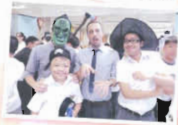
開心哈囉喂，師生齊來搞氣氛