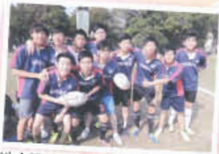
初生之慣不畏虎，檯球隊隊員活力十足