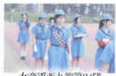
女童軍西九龍第24隊