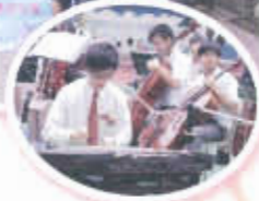
中西弦樂奏出段段動人樂章，餘音裊裊