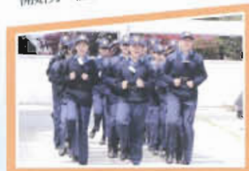
多元智能挑戰營，學員英姿煥發，幹勁十足 大哥哥大姐姐訓練課程，小心翼翼完成任務