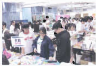
同學書海愛漫遊，盡享閱讀樂