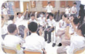
中一迎新日，「大哥哥」與學弟學妹玩玩小遊戲