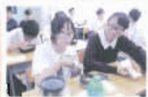
初中生留校用膳，吃得健康

合約飯商每天提供多款不同新鮮美食，照顧學生所需營養。本校亦設體適能獎勵計劃，以提升學生健康水平，並定期舉辦不同體育活動，積極鼓勵學生參與，強壯體魄。同時，本校致力綠化校園，教育學生愛護環境，節約能源，響應廢物循環再造運動。