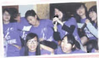
學生盛事——班際歌唱賽，各自施展渾身解數

課外活動分三組：學術及興趣、服務及制服團隊、四社及校隊。學生會、會社及功能組別亦會安排不同類型的活動。本校鼓勵同學積極參與各類課外活動，特設班際盃，以加強團體精神及發揮潛能。中一推行「一人一體藝」計劃，並鼓勵參加「一人一制服團隊」。