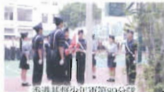
香港基督少年軍第89分隊

於社會服務方面，本校師生不遺餘力，回饋社群：制服團隊如男女童軍、基督少年軍、航空青年團、公益服務團及少年警訊不時參與不同大型活動，提供社會服務。