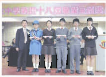
第四十八屆畢業暨頒獎典禮，同學一年來的努力得到了肯定

2013年香港中學文憑考試，「生物」、「中國歷史」、「數學延伸部分(M2)」、「組合科學(生物/化學)」及「旅遊與款待」考獲二級或以上之百份率均高於全港日校成績。