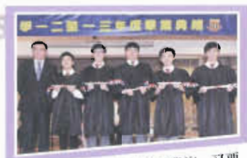
中六結業禮，同學穿了畢業袍，又要開始另一個新里程