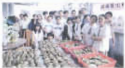
同學獻愛心——踴躍愛心稱職長者

本校校風純樸，紀律嚴明，同學皆以承擔責任、律已敬人為己任。各科組通力合作舉辦活動如網上自學、訪問、交流、敬師愛生及自律助人活動、禮貌運動、德育短講、青苗營、茁壯營、多元智能挑戰營、大哥哥大姐姐計劃、青少年入樽計劃及TEEN行者訓練計劃。本校營造關愛文化，推動學生發揮自重重人精神回饋社會，關愛社羣，建立積極的人生觀，成為一個勇於拓展、敢於承擔的良好公民。整體學校充滿和諧喜悅的氣氛，洋溢一片關愛友好的歡欣之情。