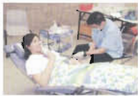
同學捐血救人，發揚關愛精神