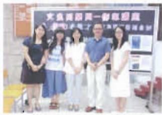
科幻作家李偉才先生到校分享寫作心得

本校中一至中六採用母語教學。按照中學教學語言微調政策，會為適應較快的學生開設以英語授課之科目。另外，為培訓學生掌握兩文三語能力，本校開設中英文輔導班及增潤班，並舉辦英文週、中文週、普通話週、閱讀獎勵計劃等活動。