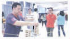
教職員專業發展日——釋疑解難，訓練協作能力

強調學生全人發展，提高學習風氣及兩文三語的水平，重視學生的學業和紀律表現，推行專題研習，訓練自學及共通能力。