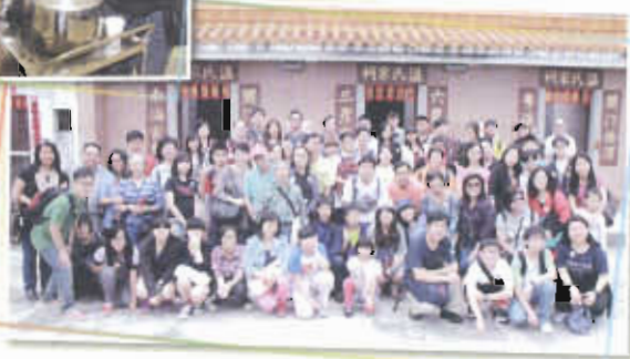
家長教師會週年大旅行 —沙頭角村 溫氏宗祠前 留影