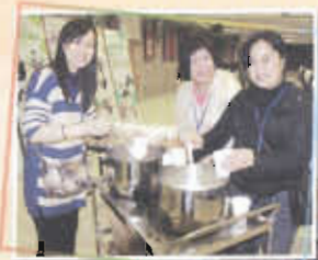
家教會「愛心糖水」借別中六畢業同學

本校於1993年成立家長教師會。藉著家校合作活動，建立更密切的夥伴關係，家長教師會為學校提供不少支援，設獎學金，以幫助學生發展潛能，提升教育質素。另外，家長教師會不時舉辦多項親子活動、講座及興趣班等，讓家長互相分享經驗，強化親子教育，加強家長與子女的溝通。家長教師會更組織親子義工隊，投入社區，服務社羣，發揚「仁愛互助」的精神。